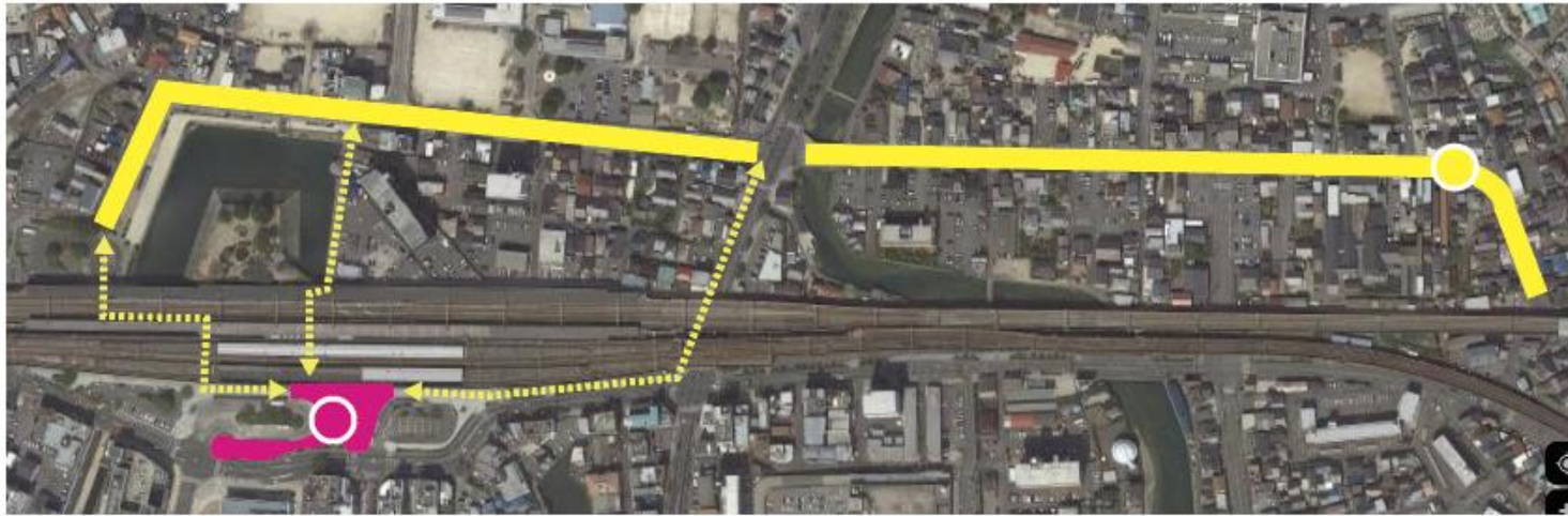
みはら神麺市会場 三原神明市会場 バルーン大ダルマ 神明大ダルマ

同期間で開催される三原神明市は毎年約40万の人出で賑わいます。また神明市のシンボル「大ダルマ」に加え、みはら神麺市の会場には「バルーン大だるま」を設置すると共に、出店者の皆様の魅力的なブースが集まることで、三原神明市の会場となる駅北側と本イベントの会場となる駅南側との人の流れを生み出し、より多くの賑わいを作り出します。